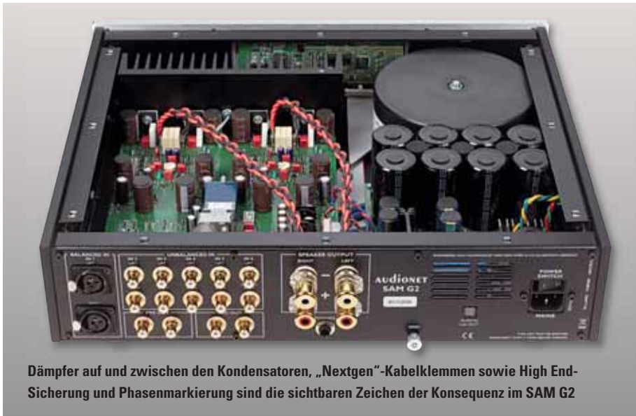
Dämpfer auf und zwischen den Kondensatoren, „Nextgen“-Kabelklemmen sowie High End-Sicherung und Phasenmarkierung sind die sichtbaren Zeichen der Konsequenz im SAM G2

buchsen sowie goldkontaktierte Doppelanker-Relais ein. Für die Boxenkabel sind hochwertige „Nextgen“-Klemmen des Essener Spezialisten WBT montiert, deren klangliche Überlegenheit gegenüber Standardlösungen dem Audionet-Team während ausgedehnter Hörsitzungen nicht verborgen blieb.